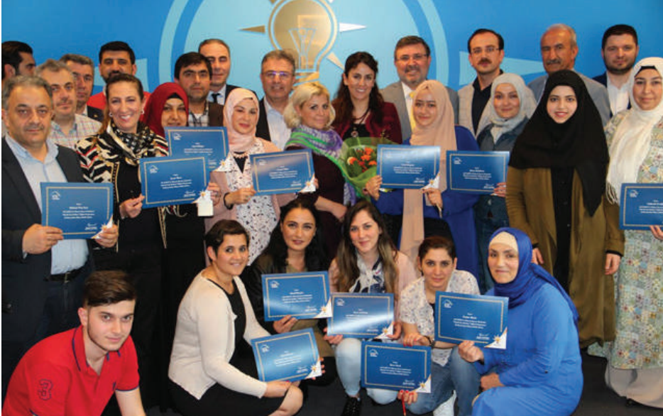
جمع من المتخرجين الحاصلين على شهادات تخرج من أكاديمية السياسة