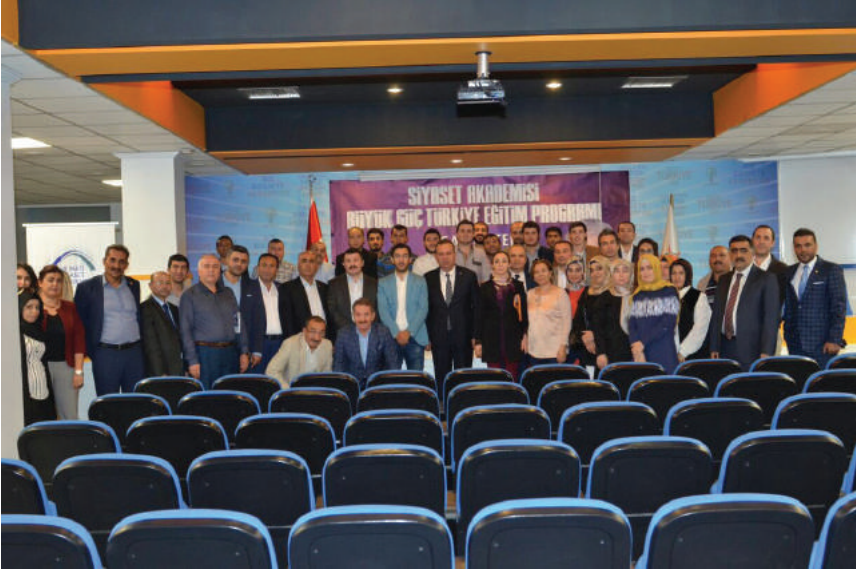
صورة من المدرسين والمشاركين في محاضرات أكاديمية السياسة في مدينة غازي عنتاب (Qaziantep) التركية