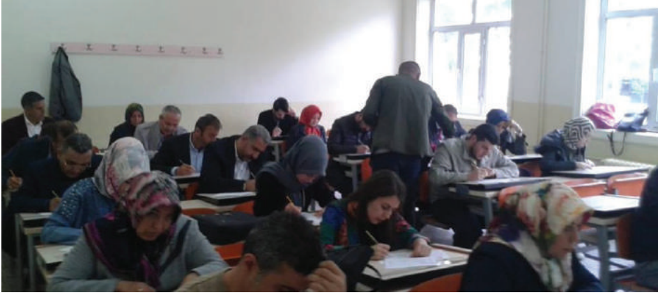
الاختبارات النهائية لدورات أكاديمية السياسة التعليمية