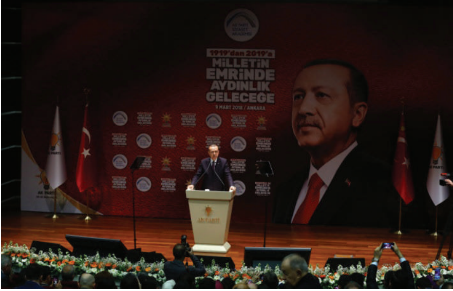
كلمة أردوغان في مراسيم افتتاحية إطلاق محاضرات أكاديمية السياسة