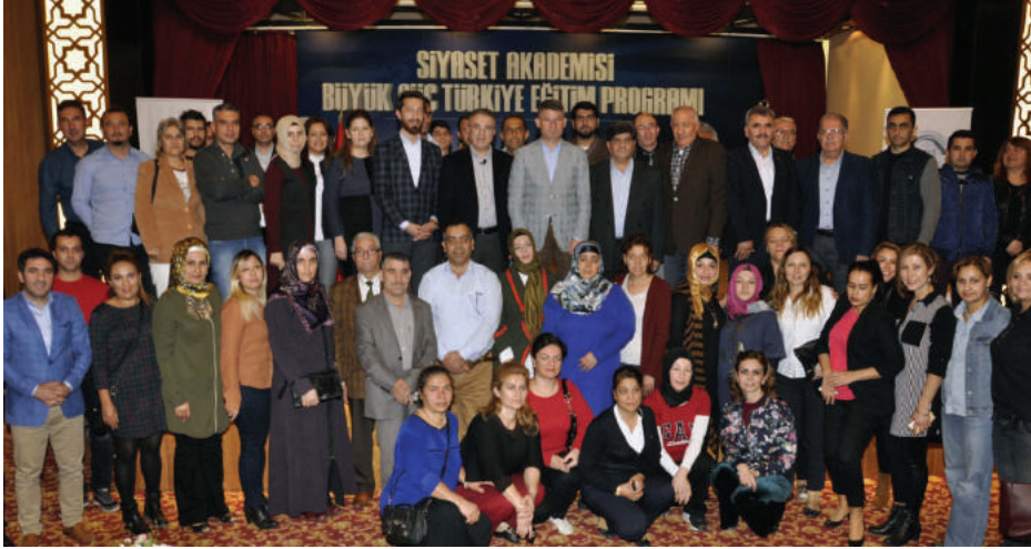
صورة للمدرسين والمشاركين في محاضرات أكاديمية السياسة في مدينة أضنة (Adana) التركية