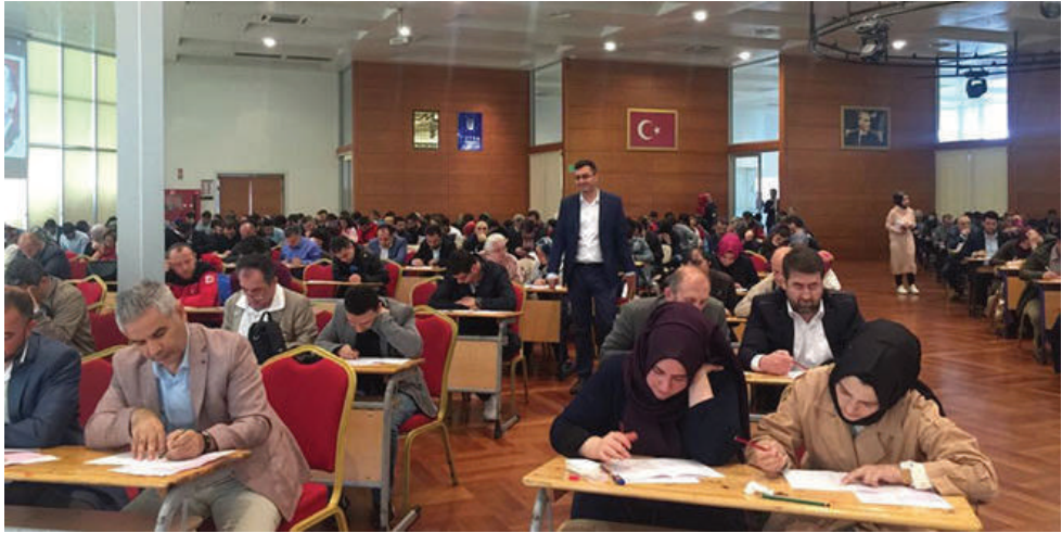
الاختبارات النهائية لدورات أكاديمية السياسة التعليمية