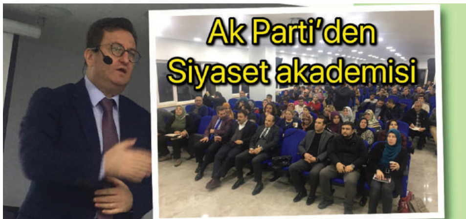
أجواء الدرس والصفوف في أكاديمية السياسة