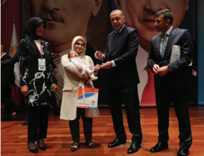
أردوغان يكرم المتفوقين في دورات أكاديمية السياسة