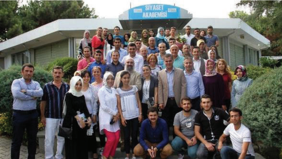
صورة للمدرسين والمشاركين في محاضرات أكاديمية السياسة