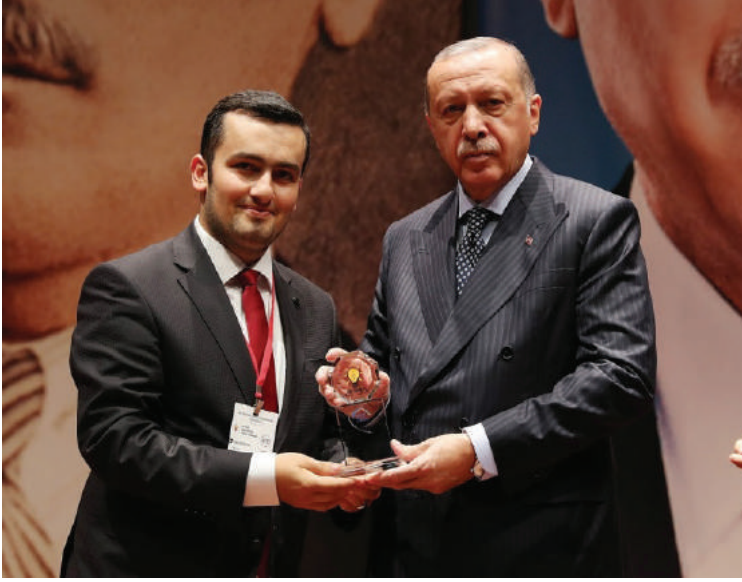
أردوغان يكرم المتفوقين في دورات أكاديمية السياسة