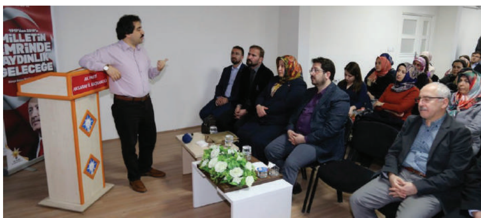
أجواء الدرس والصفوف في أكاديمية السياسة