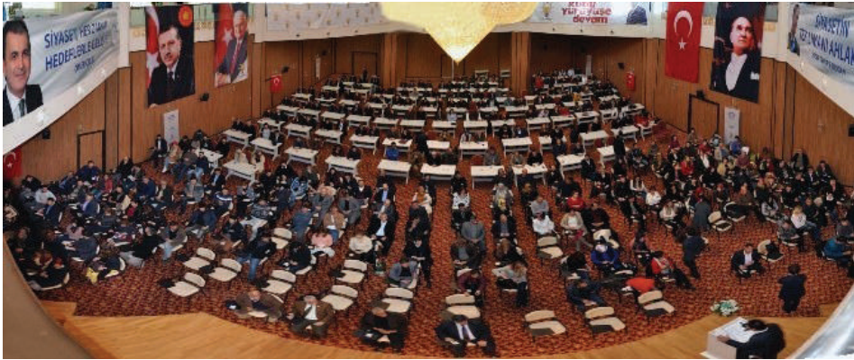
الاختبارات النهائية لدورات أكاديمية السياسة التعليمية