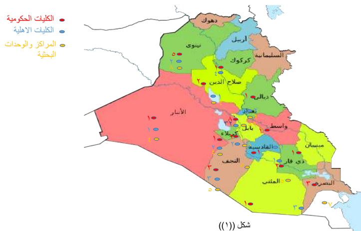
شكل (١) مواقع واعداد المؤسسات العلمية والتابعة لوزارة التعليم العالي والبحث العلمي حسب المحافظات